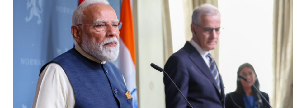
ఢిల్లీ : ప్రధాని నరేంద్ర మోదీ నార్వే పర్యటనలో అసక్తికర ఘటన చోటు చేసుకుంది. భారత ప్రజాస్వామ్యం, మీడియా స్వేచ్ఛ పై ప్రశ్నలు లేవనెత్తిన ఓ నార్వేజియన్ జర్నలిస్టుకు, ఘాటుగా సమాధానం ఇచ్చిన బిదేశాంగ శాఖ అధికారి ఘాటుగా సమాధానం మిచ్చారు. 'ఏమైనా సమస్యలుంటే కోర్టుకు వెళ్లండి' అంటూ ఆయన ఇచ్చిన జవాబు ప్రస్తుతం సోషల్ మీడియాలో వైరల్ అవుతోంది. బిదేశాంగ శాఖ పర్యటనలో భాగంగా - మిగతా 2 లో