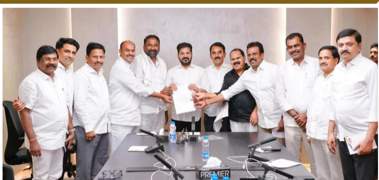
హైదరాబాద్ : ముఖ్యమంత్రి రేవంత్ రెడ్డి ఉమ్మడి మహబూబ్ నగర్ జిల్లా మంత్రులు, ఎమ్మెల్యేలతో భేటీ అయ్యారు. ఆ జిల్లా సాగునీటి ప్రాజెక్టు పనుల పురోగతిపై ఎంపీ ఆర్ హెచ్ ఆర్ డీలో సమీక్షా సమావేశం నిర్వహించారు. పాలమూరు-రంగారెడ్డి ప్రాజెక్టు భూసేకరణ ప్రక్రియను యుద్ధ ప్రాతిపదికన పూర్తి చేయాలని ఆదేశించారు. సాగునీటి ప్రాజెక్టులకు సంబంధించి - మిగతా 2 లో

ఉమ్మడి మహబూబ్ నగర్ జిల్లా మంత్రులు, ఎమ్మెల్యేలతో సీఎం రేవంత్ రెడ్డి భేటీ - సాగునీటి ప్రాజెక్టు పనుల పురోగతిపై సమీక్షా సమావేశం - పెండింగ్ బిల్లులను క్లియర్ చేయడానికి ప్రభుత్వం సిద్ధంగా ఉందని హామీ