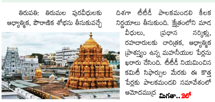
తిరుపతి: తిరుమల పురవీధులకు దివ్య డిజైన్ పాలకమండలి కీలక ఆధ్యాత్మిక, పౌరాణిక శోభను తీసుకువచ్చే నిర్ణయాలు తీసుకుంది. క్షేత్రంలోని మాడ వీధులు, ప్రధాన సర్కిళ్లు, రహదారులకు చారిత్రక, ఆధ్యాత్మిక ప్రాశస్త్యం ఉన్న మహానీయాల పేర్లను ఖరారు చేసింది. డిజైన్ నియమించిన కమిటీ సిఫార్సుల మేరకు ఈ కొత్త పేర్లకు పాలకమండలి సమావేశంలో ఆమోదముద్ర విగత..26

భక్తుల సౌకర్యార్థం రూ.కోట్ల విలువైన అభివృద్ధి పనులకు ఆమోదం తిరుమల వీధులు, సర్కిళ్లకు ఆధ్యాత్మిక, పౌరాణిక పేర్లు ఖరారు నాలుగు మాడ వీధులకు నాలుగు వేదాల పేర్లతో నామకరణం ధూపదీప నైవేద్యాల సాయాన్ని రూ.5,000 నుంచి రూ.10,000కు పెంపు అలిపిరి వద్ద రూ.4.75 కోట్లతో శ్రీనివాస దివ్యానుగ్రహ హోంం యాగశాల