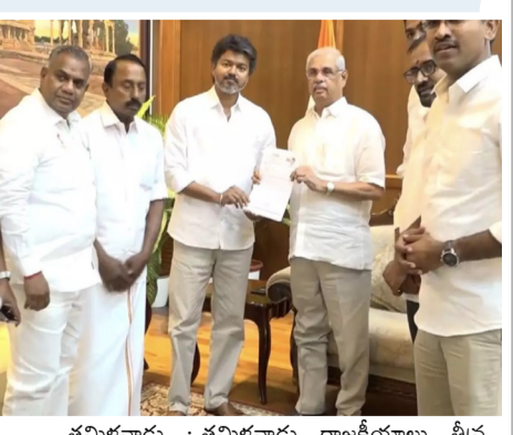
తమిళనాడు : తమిళనాడు రాజకీయాలు తీవ్ర ఉత్కంఠ రేపుతున్నాయి. ఎన్నికల్లో అద్భుత విజయం సాధించిన నటుడు విజయ్ నేతృత్వంలోని విగత..26