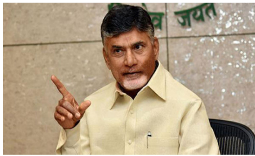
అమరావతి: సీఎం చంద్రబాబు నాయుడు ప్రసాద్, మంత్రిలు, జిల్లాల కలెక్టర్లు, వివిధ శాఖల ఉన్నతాధికారులు పాల్గొన్నారు. సదస్సు ప్రారంభంలో 'బిజినెస్ రిఫార్మర్ ఆఫ్ ద ఇయర్' అవార్డు దక్కించుకున్నందుకు విగత..26