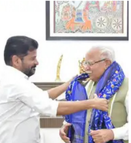
ఆయన విమానాశ్రయంలో విలేకరులు అడిగిన ఒక ప్రశ్నకు స్పందించారు. 'కేరళలో కాంగ్రెస్ విజయం సాధించింది. అక్కడ రాజుల్, ప్రియాంకా గాల్వాడి, మల్లికార్జున ఖర్గేలు నరేంద్ర మోదీ, విగత..26