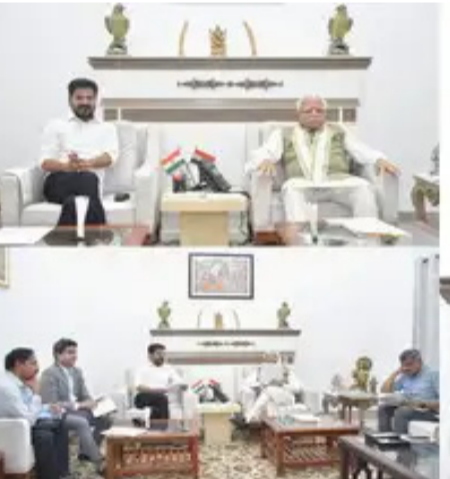
న్యూఢిల్లీ: తాజాగా జరిగిన ఐదు రాష్ట్రాల ఎన్నికల్లో భాగంగా కేరళలో ప్రధాని మోదీ, కేంద్ర హోంమంత్రి అమిత్ షాను ఓడించామని సీఎం రేవంత్ రెడ్డి వ్యాఖ్యానించారు. బుధవారం మధ్యాహ్నం ఢిల్లీకి వచ్చిన విగత..26